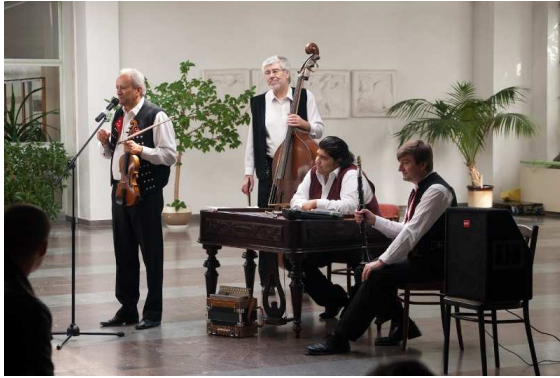
VKŠ – Ako sme pesničky obliekali (autor Juraj Hatrík)