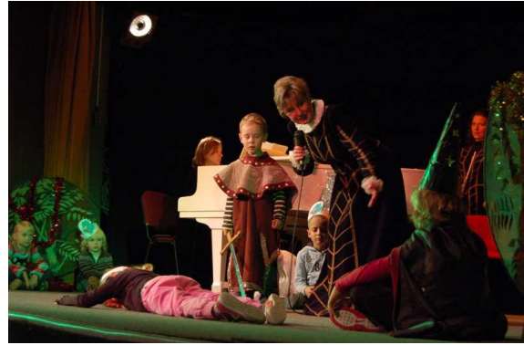
VKŠ - Popolvár (autorka Marta Pažická)