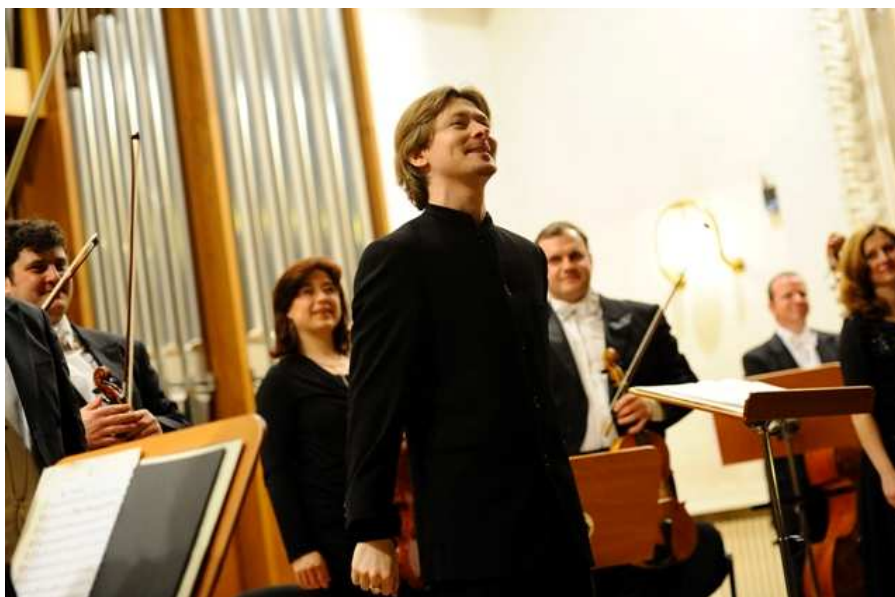
Sergej Nakariakov (Rusko)